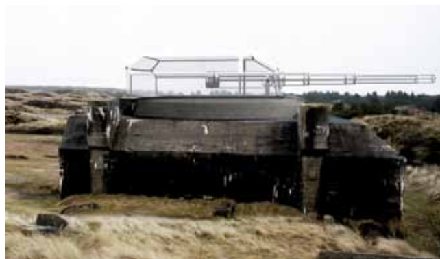
Computergrafik af BIG's glaskanon på toppen af bunkeren.