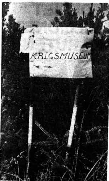
Skiltningen til krigsmuseet i Hanstholm er endnu, noget mangelfuld, men tyskerne finder frem til stedet i stort tal. Over en tredjedel af de besøgende er tyskere med en fortid.

truende bærere af en aggressiv kultur, der stadig tilbød nationalsocialismen. I artiklens egentlige ærinde, der tilsyneladende var et angreb på den europæiske integration i form af det Europæiske Fællesmarked, blev omdannelsen af bunkerne til museer altså brugt til at skabe forargelse. Set i dette lys var det ingen selvfølge at finde gehør for at omdanne bunkerne til museer. Det kunne gå an, at de blev betragtet som turistattraktioner for danske turister i 1945, men det gik ikke an at bruge besættelsesmagtens synlige efterladenskaber på at underholde dens efterkommere, der "besatte" den danske vestkyst igen, denne gang med campingvogne og strandtæpper.