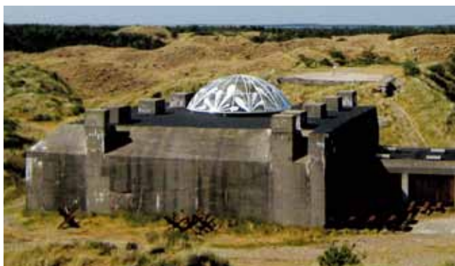
Tirpitz-bunkeren som den ser ud i dag med kuppel over kanonbrønden.

Når museet ikke møder forargelse over at udstyre en tysk bunker med en erstatning for den kanon, der ellers næsten symbolsk lå strandet på Guldager Station efter den 5. maj 1945, er det en tendens, der kan spores generelt i forhold til de tyske bunkers. De seneste år har såvel Ringkøbing-Skjern Museum som Museet for Varde By og Omegn haft stor succes med at invitere på bunker-ture i landskabet, og som det kan ses her i opdatering har Ringkøbing-Skjern Museum i 2012 åbnet en velbesøgt