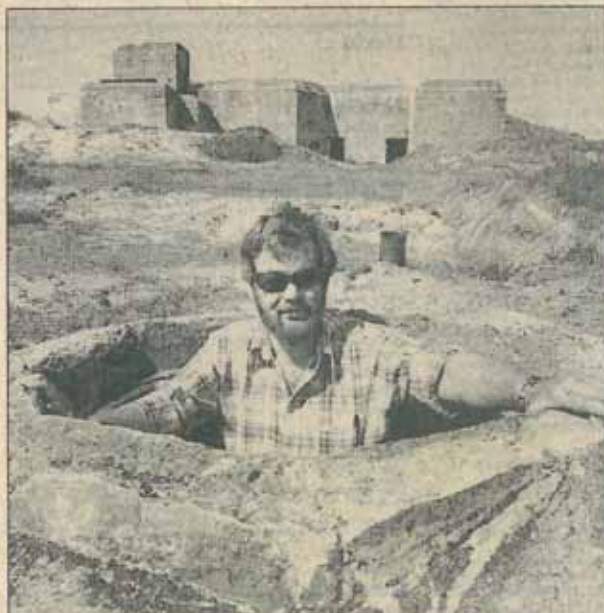
Tirpitz-stillingen, opholdt efter en tysk admiral fra første verdenskrig, består af flere bunkersanlæg med underjordiske forbindelsesgange.

Class Ekeberg i Beskæftigelseshuset, Industrivej 20, 6840 Oksebo, vil meget gerne høre fra nogle af dem, der var med. psj