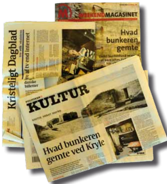
Et par avisforsider fra månederne efter åbningen.

Og det er ikke kun museumsgæster, der vil høre mere om livet i nazisternes fæstningsværker. Også journalister fra nær og fjern finder vej til Ringkøbing. Normalt skal vi rykke frem med et helt arsenal af små tricks for at lokke bare mellemstore medier til at dække udstillingsåbninger. Så det var en ret interessant oplevelse – ja, måske en once-in-a-lifetime-experience – for en udstillingstilrettelægger