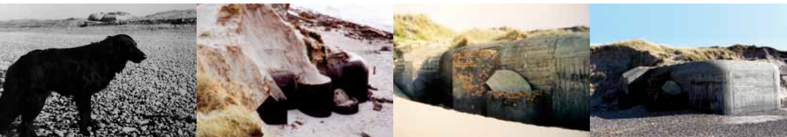
På billedet med hunden, der er taget engang i 1950-60'erne, aner man ildlederbunkeren i baggrunden, mens de andre betonklodser er gemt under sandet. Som fotografier fra 1991, 2000 og 2005 viser, gnavede havet imidlertid langsomt sandet væk over Saalfelds bunker, og i 2008 havde kystnedbrydningen gjort arbejdet færdigt. Indgangen, der vender væk fra brændingen, blev tilgængelig.

Men sådan blev det slet ikke. Der er ingen, der har meldt sig offentligt som kritikere af vores dispositioner. Til gengæld spiller udstillingen tilsyneladende en rolle, som vi ikke havde turdet håbe på, da vi gik i gang i efteråret 2011. Vi kan se, at Ringkøbing Museum er blevet et medie for forsoning mellem danskere og tyskere, mellem fortidens besatte og fortidens besættere. Museets danske gæster bruger udstillingen som en påmindelse om, at Anden