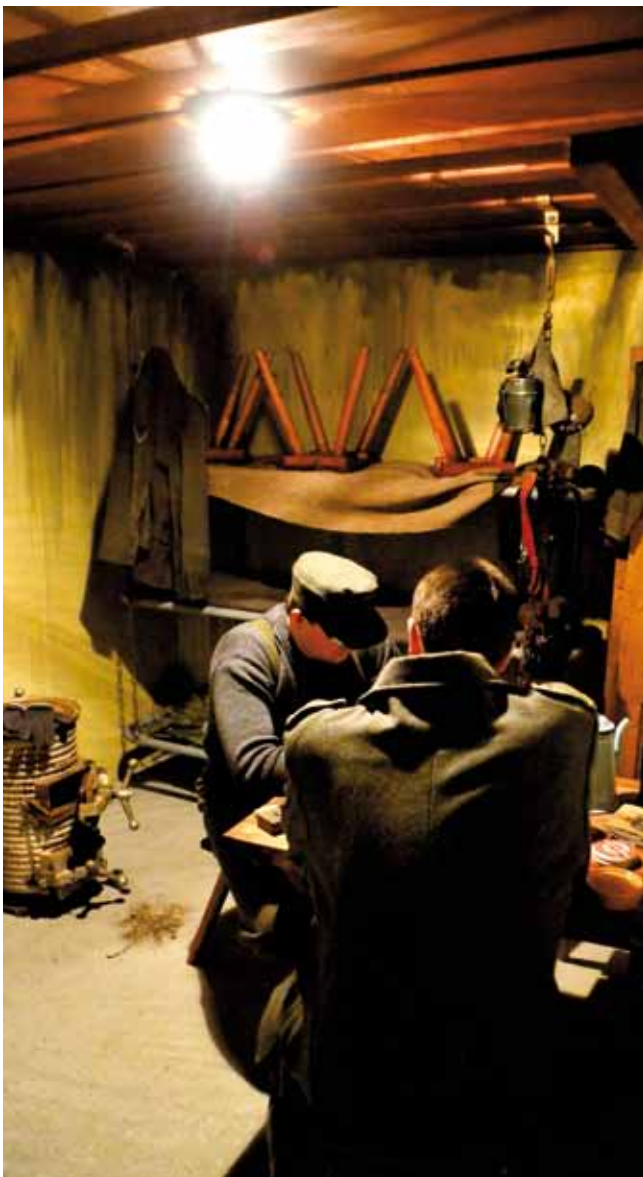
Udstillingens rekonstruerede bunker.