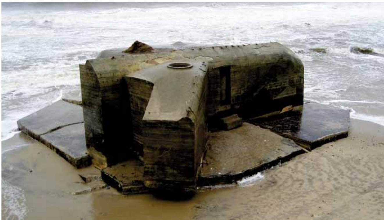
Mens vi byggede udstillingen, stod Saalfelds bunker næsten i brændingen. Nu er det anderledes igen. Som et led i den løbende kamp mod kystnedbrydningen blev stranden i Houvig forsynet med et tykt tæppe af frisk sand i efteråret 2012. Så nu er havet trængt tilbage for en tid.

miner. Når Ringkøbing-Skjern Museum lader en af deres egne fortælle en historie fra den gang, og oven i købet lader hans vidnesbyrd stå uimodsagt, så oplever de det som en gestus. Det betyder ikke, at hverken vi eller de tyske turister skal glemme jødeudryddelse, voldsregimente og uret. Men der er gået flere generationer. Anden Verdenskrig er en fælles europæisk erfaring, som nutidens tyskere er lige så lidt ansvarlige for som danskerne. Egentlig siger det vel sig selv. Ikke desto mindre oplever vi, at tyske gæster kommer hen til os, når de har set udstillingen, giver os hånden og takker os.