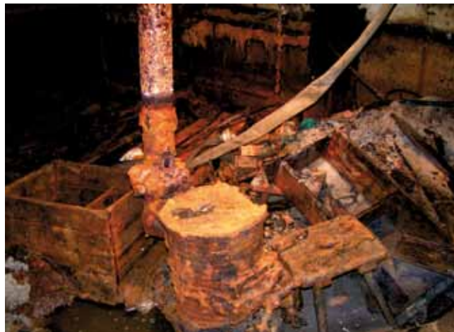
63 år i saltvand og mudder er hård kost for genstande af jern og træ.

Men de gode folk i Ølgod har kæmpet bravt med at få de vigtigste af tingene gjort klar, og i efteråret 2011 traf vi en beslutning. Ringkøbing-Skjern Museum ville lave udstillingen, mens Gerhard Saalfeld kunne rejse til Vestjylland, og mens den store medieomtale fra 2008 var i nogenlunde frisk erindring. Vi hentede tingene hjem, både det, der er konserveret, og det, der ikke er, og som nu står og smuldrer langsomt under spotlyset. Nogle gange er museums-virksomhed det muliges kunst.