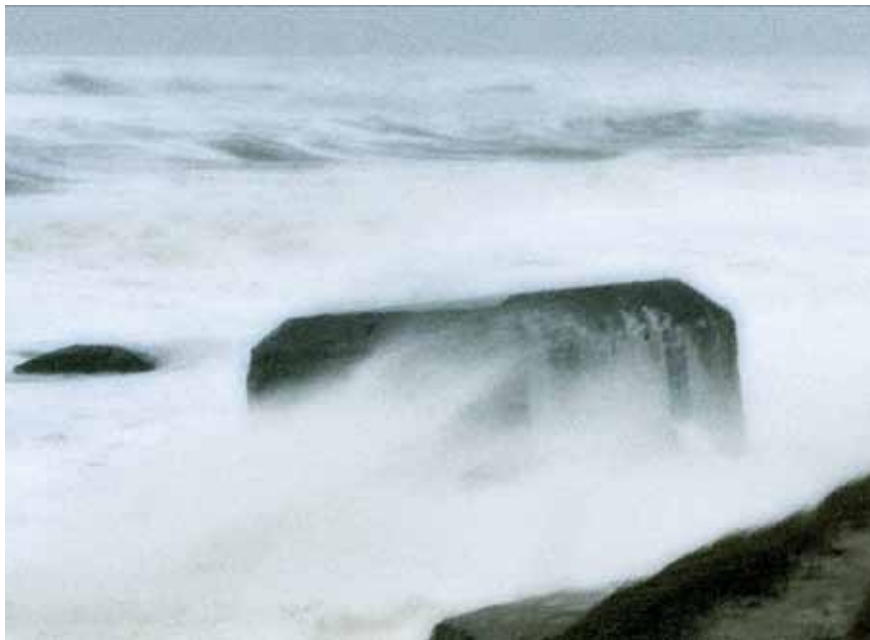
Elementerne slider hårdt på Kryle-bunkerne, når stormen rigtig tager fat. Billedet er taget i orkanstyrke i december 2011.