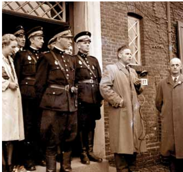
Det danske politi genindsættes i Skjern efter befrielsen.

Når vi beskæftiger os med den popularitet, Anden Verdenskrig er genstand for i disse år, bør vi ikke overse, at vi oplever en interesse for krigshistorie i det hele