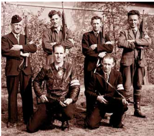
Frihedskæmpere i Tarm fotograferet efter befrielsen.

Flygtningelejren i Oksbøl er endnu et emne for Museet for Varde By og Omegns med umiddelbar tilknytning til Anden Verdenskrig. Indtil 2012 husede Blåvandshuk Egnsmuseum i Oksbøl en mindre udstilling om de tyske flygtninge. Denne udstilling er midlertidig nedtaget, men vi planlægger at nyopstille den i foråret 2013 i et lokale på Ravmuseet i Oksbøl. På lidt længere sigt kan der åbne sig en mulighed for, at museet kan få lokaler i flygtningelejrens gamle lazaret, der gennem de sidste mange år har fungeret som vandrerhjem. Denne placering vil være noget nær ideel, fordi udstillingen derefter vil være placeret i de autentiske omgivelser og blive nabo til det gamle lejrområde vest for lazaretet samt flygtningekirkegården, der hvert år besøges flittigt af især tyskere, men også danskere og andre historisk interesserede. Historien om de tyske flygtninge har gennem de seneste 5-6 år været et forskningsområde på Museet for Varde By og Omegn med flere videnskabelige artikler og en