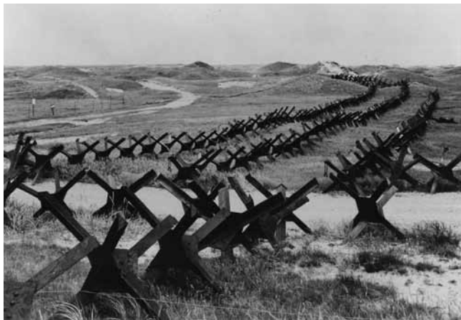
Den tyske besættelse satte tydelige spor i det vestjyske. Her er det tank- og pigtrådsspærringer ved Vejers strand.

Fra begyndelsen af 1990'erne skete der noget nyt, idet besættelsens traditionelle hovedaktører: politikerne og