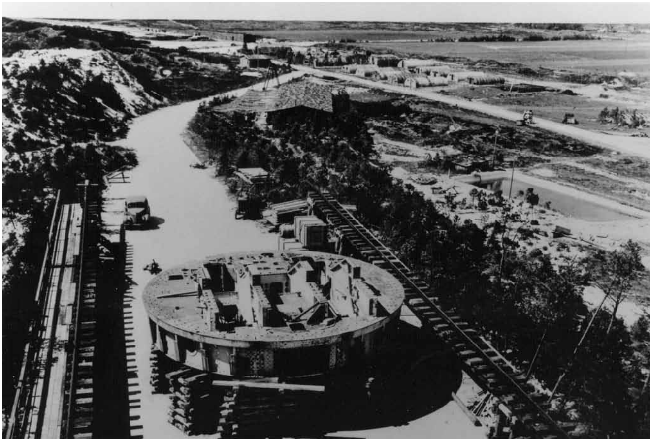
Udsigt fra Tirpitz-stillingen. Bemærk den såkaldte "Russerlejr" øverst til højre i billedet. I lejren boede russiske krigsfanger, der under kummerlige forhold arbejdede for tyskerne.

fornyes og nytænkes. Det er planlagt til at ske sammen med etableringen af Museumscenter Blåvand. Der er ingen tvivl om, at der qua tidens interesse for Anden Verdenskrig er behov for at fortælle historien om Atlantvolden og Tirpitz igen på en ny måde med inddragelse af de nyeste formidlingsformer.