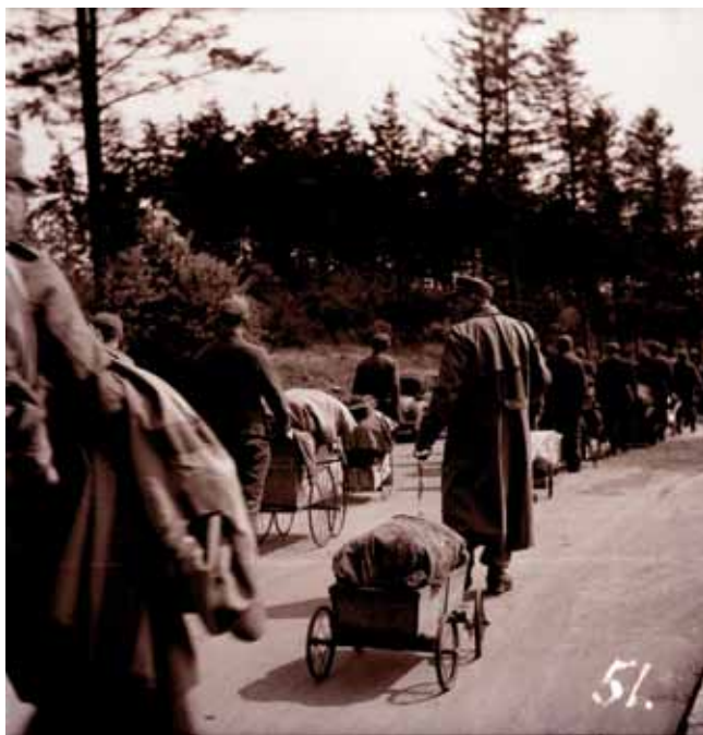
Den slagne tyske hær forlader Danmark til fods. Billedet er taget ved grænsen i maj 1945.

Spørgsmål, der før blev anset for følsomme, måske fordi endnu levende personer stod i vejen for en nærmere udforskning, kan stilles nu, og svarene kan skabe større klarhed. Måske kan vi endda i mange tilfælde bedre end tidligere håndtere og sætte os ind i de problemstillinger, som datidens mennesker stod over for. Denne udvikling har åbenlyst sine fordele, men også sine ulemper. Anden Verdenskrig har indtil nu, som ingen anden historisk periode, været i stand til at skabe samfundsdebat og engagement. I fremtiden skal vi måske gøre os mere umage, hvis vi vil bevare besættelsestidens rolle, men indtil videre er