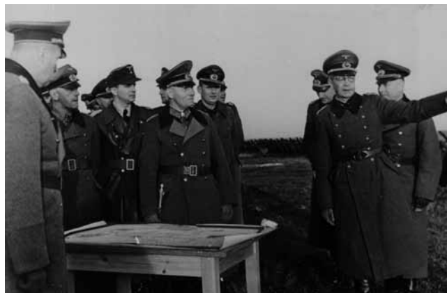
Feltmarskal Erwin Rommel (i midten) under sit besøg på vestkysten i begyndelse af december 1943. Helt til venstre i billedet ses den øverstbefalende for de tyske tropper i Danmark general von Hanneken.

I årene umiddelbart efter befrielsen udkom større værker om de fem år fra radikalt, socialdemokratisk og konservativt hold, der hver især tolkede begivenhederne ud fra deres præmisser og ikke mindst politiske anskuelser. Tidligere udenrigsminister P. Munchs radikale version understregede især statsmagtens vanskeligheder under den tyske besættelse, mens det i Hartvig Frischs socialdemokratiske optik handlede om et forsvar for samarbejdsregeringerne og forholdet til kommunisterne. Den tredje version som Vilhelm la Cour stod i spidsen for præsenterede et opgør med tredivernes forsvarspolitik. Så var banen kridtet op.