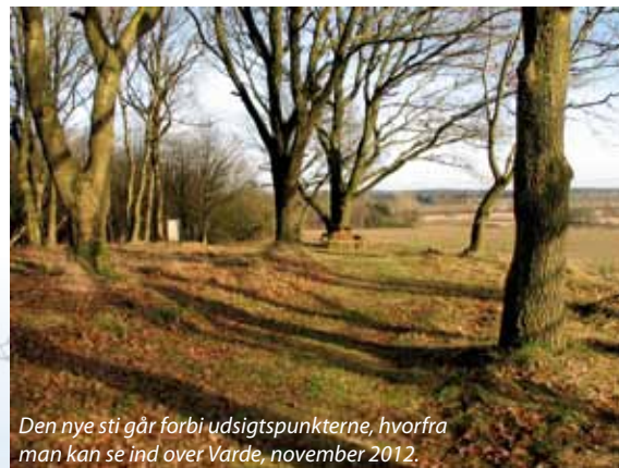
Den nye sti går forbi udsigtspunkterne, hvorfra man kan se ind over Varde, november 2012.