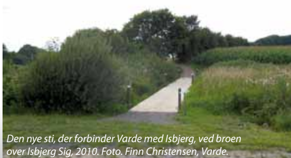
Den nye sti, der forbinder Varde med Isbjerg, ved broen over Isbjerg Sig, 2010.