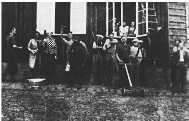
"Arbejdsholdet" fra en af de ugentlige arbejdsaftener på Isbjerg, formentlig slutningen af 1930'erne (efter Bruhn).

medlemskort til foreningen efter konfirmationen. Møderne blev holdt hver onsdag aften på Højskolehjemmet, hvor der blev arrangeret foredragsaftener og fælleslæsning samt afholdt en julefest, der var et af årets højdepunkter. Om sommeren mødtes medlemmerne på Isbjerg, hvis ikke der var arrangeret cykelture eller udflugter for de unge.