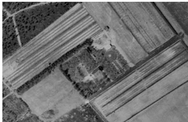
Isbjerg med haveanlæg og festplads (Basic Cover 1954).