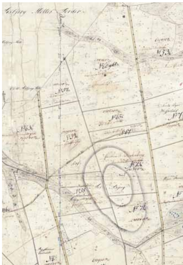
Isbjerg ligger som en relativt høj bakke mellem "Meil Siig" og "Isbjerg Siig". Original 1. Varde Markjorder 1819-1881.

På toppen af Isbjerg findes afmærkningen af en trigonometrisk station – en universalkalot af jern i jordniveau. Punktet indgår i det overordnede danske referencenet,