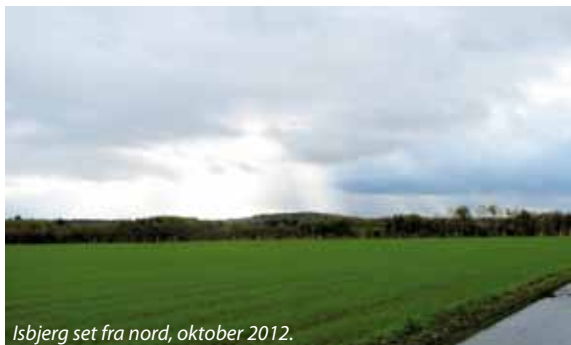
Isbjerg set fra nord, oktober 2012.