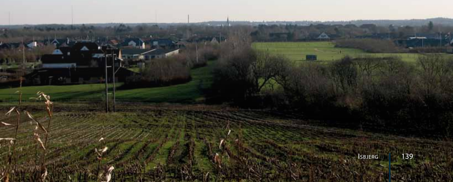
Udsigten fra Isbjerg ind mod Varde med Jacobi Kirkes spir i det fjerne, november 2012.