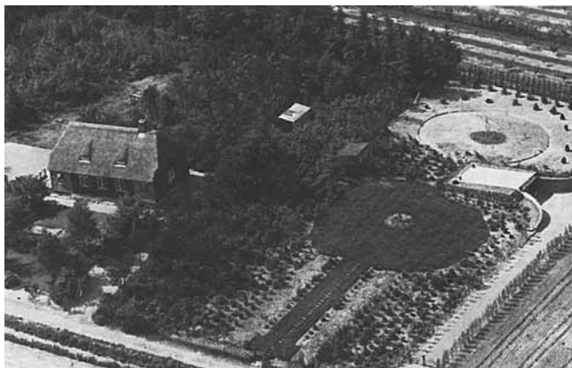
Isbjerg omkring 1950 (efter Andreasen).