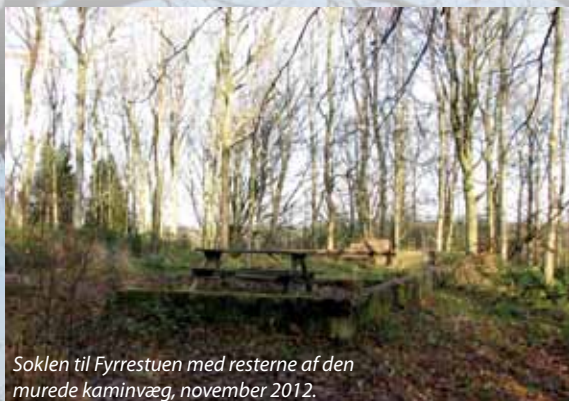
Soklen til Fyrrestuen med resterne af den murede kaminvæg, november 2012.

til Isbjerg med en bro over moseområdet, Isbjerg Sig. Samtidigt så man muligheden for at oprette et primitivt overnatningssted med shelters og bænke i tilknytning til stien. Gennem grundejerforeningen for Bjerget søgte man et beløb fra Tips- og Lottomidler til Friluftslivet og fik i 2010 gennem Grønne partnerskaber de nødvendige midler, der sammen med et stort frivilligt arbejde gjorde det muligt at realisere idéerne. Med den nye natursti, der har forbindelse med stisystemet, som går nord ud af byen fra Mølle-kvarteret, har befolkningen fået en lettere adgang til Isbjerg, der har været udflugtsmål og udsigtspunkt for flere generationer i Varde. 13