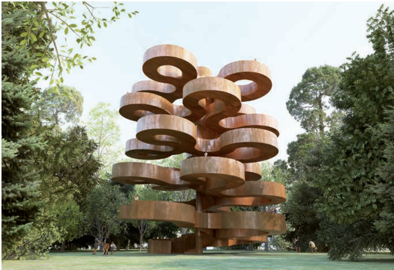
Endnu et smugkig på en del af det kommende flygtningemuseum i Oksbøl. Her er det udsigtstårnet i skoven, der både skal fungere som et ikon for det nye museum og som udsigtspunkt, der skaber mulighed for et overblik over lejrområdet. Illustration BIG Bjarke Ingels Group.

dag har vi henvend 1.300 medlemmer i de støtteforeninger, der er tilknyttet museet. De skal også kunne mærke en fordel af de nye afdelinger, ligesom vi gerne vil være endnu bedre til at bruge lokale frivillige på de steder i vore udstillinger, hvor det giver mening for dem og for os.