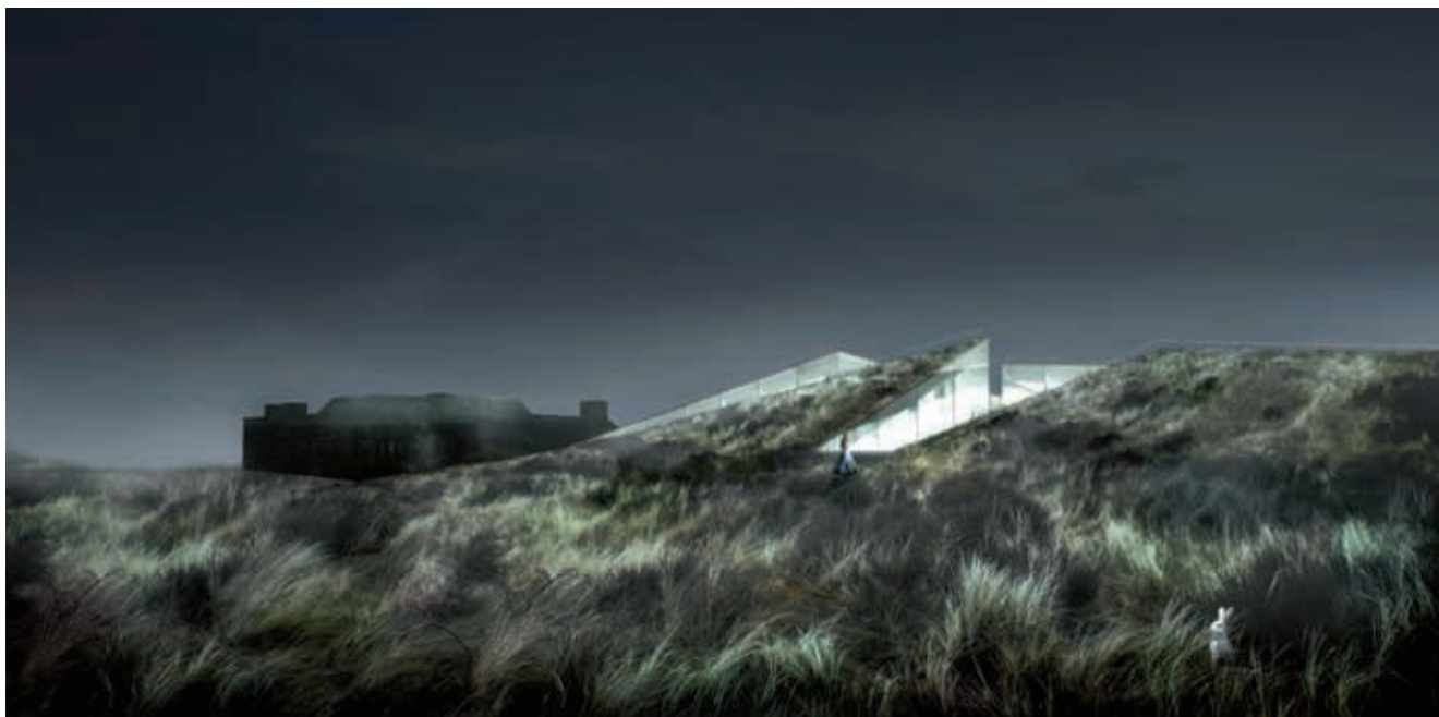
Et smugkig på det nye museum ved Tirpitz, som det kommer til at se ud når det åbner i 2017. Projektet er undfanget under vores første udviklingsplan, udviklet under vores 2. udviklingsplan og museet fødes i begyndelsen af udviklingsplan nr. 3. Så driften af det museum bliver en væsentlig del af den tredje udviklingsplan. Illustration BIG Bjarke Ingels Group.

Og hvad bliver så overskriften for denne nye udviklingsplan? Foreløbigt arbejdes der med en titel, der er