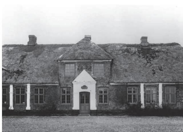
Hovedbygningen før den store ombygning i 1941.