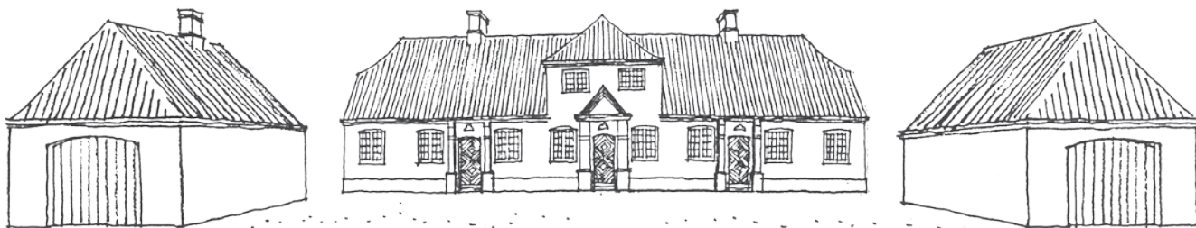
Perspektivskitse af Søviggaards hovedbygning og to små sidefløje, der skal rumme fyr- og diverse udenomsrum.