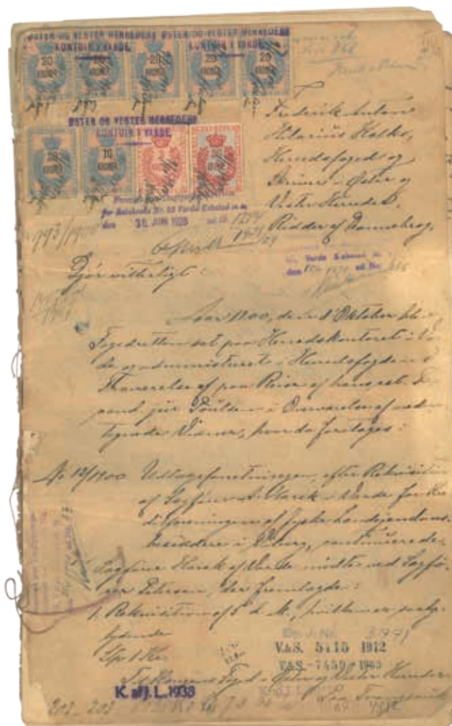
Skødet fra købet i 1900.

tørveredskaber. I det forholdsvis nyindrettede mejeri fandtes en stor balje, en øltønde, fire mejerispande, en osteopresse, et bryggersbord, en smørkærne med hestegang og